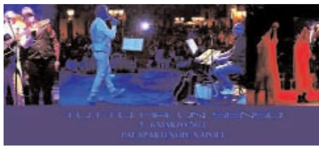
La locandina del concerto che si terrà a Napoli